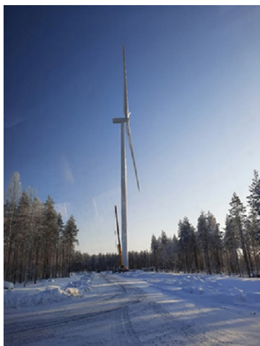
Kuva 2. Neljän MW:n tehoisen tuuliturbiinin pystytystä Konttisuo tuulivoima-alueella Soinissa Etelä-Pohjanmaalla helmikuussa 2022. Turbiinin napakorkeus ja pyyhkäisyvälimitta ovat 150 metriä. Turbiinit on sijoitettu entisen turpeenostoaalueen tieverkon varrelle.

Tulevaisuudessa tuulivoima näkyy siten kuitenkin yhä enemmän suonpohjien alueen lähiympäristön maisemassa (kuva 2).