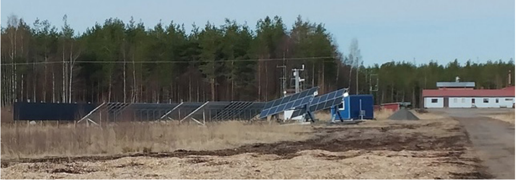
Kuva 3. EPV Energian omistama aurinkoenergiantuotannon testikenttä Alavuden Vuorennевalla.

jälkikäyttömuodot tuulivoiman rinnalla, kuten metsityksen, maatalouden tai kosteikon. Sen sijaan aurinkovoimassa paneelit peittävät yleensä hyvin suuren osan maanpinnasta ja saattavat siten estää muut jälkikäyttömuodot. Aurinkopaneelien väliin jätetäänkin usein vain sen verran tilaa, että paneelit eivät varjosta toisiaan ja ne pystytään huoltamaan, kun paneelit on sijoitettu energiantuotannollisesti katsottuna optimaaliseen 45 asteen kulmaan maanpinnasta.